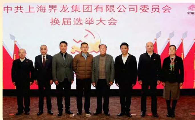
中共上海界龙集团有限公司委员会换届选举大会