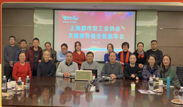
大健康专委会年会 集体照