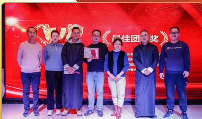
千公投资管理有 限公司召开年会